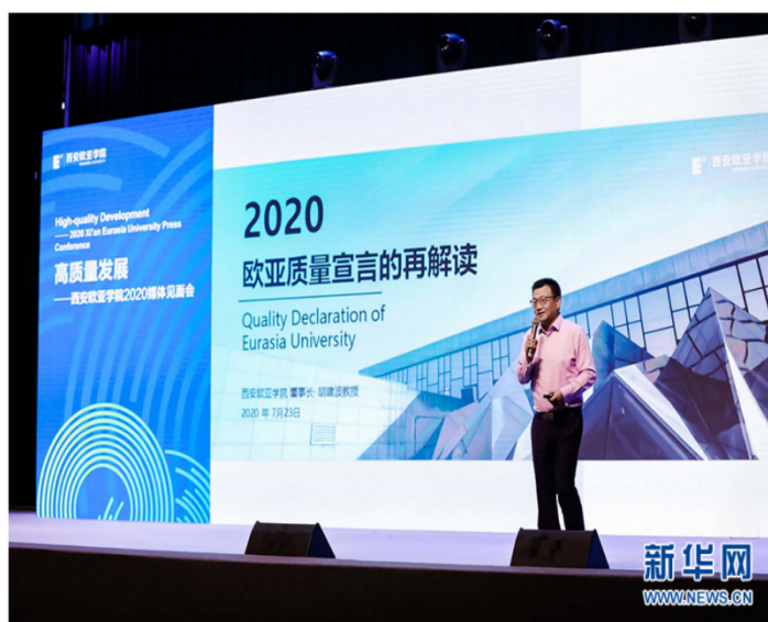
西安欧亚学院“高质量发展·西安欧亚学院2020媒体见面会”现场

新华网西安7月24日电（杨喜龙）23日下午，西安欧亚学院召开“高质量发展·西安欧亚学院2020媒体见面会”，就学校在下一个十年发展战略背景下，教育质量保障、课程体系重构等方面内容进行报告，并结合当前国内外教育形势对欧亚质量宣言进行再解读。